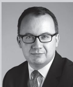
Adam Bodnar 2015–2021