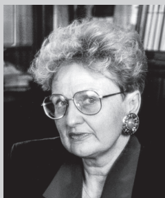
Ewa Łętowska 1987–1992