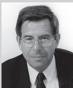
Andrzej Zoll 2000–2006