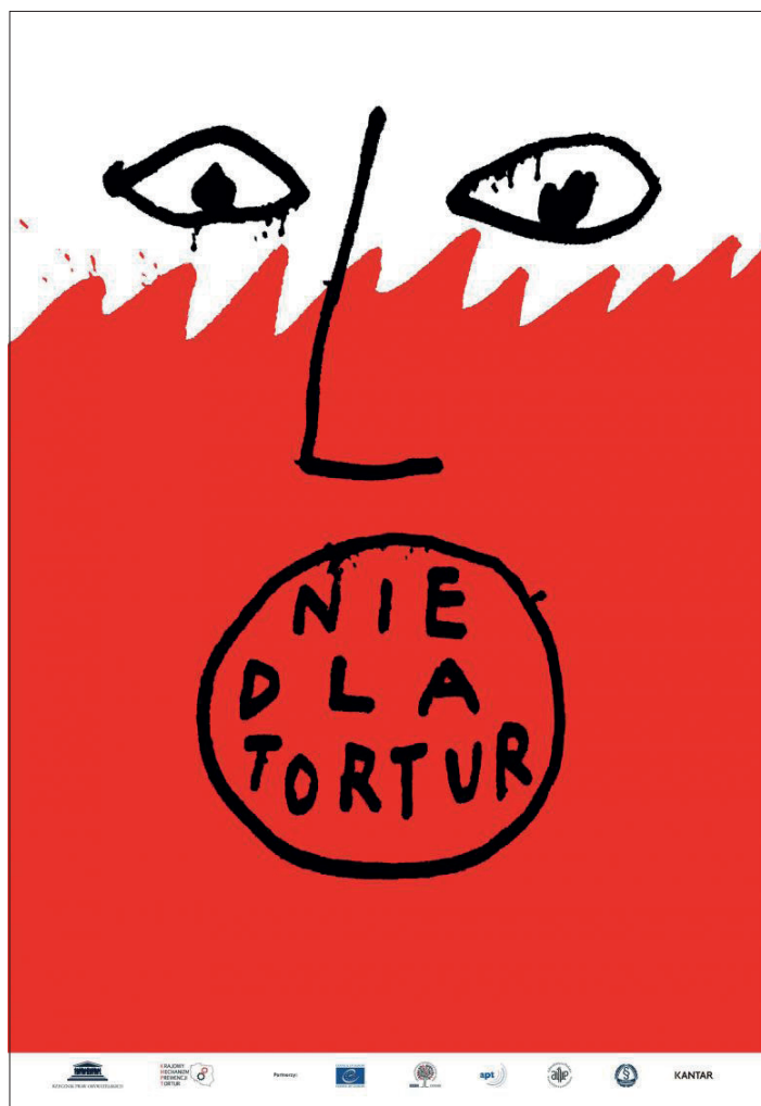
Plakat kampanii „Polska bez tortur”

niewinności i prawdy obiektywnej. Szczególną uwagę poświęcono też wnioskowi z ekspertyzy „Interwencje wobec osób z zaburzeniami psychicznymi”, która została przygotowana na zlecenie KMPT przez krajowego konsultanta w dziedzinie psychiatrii, specjalistów medycyny sądowej, ekspertów w dziedzinie prawa medycznego 22 . Spotkania z funkcjonariuszami oparte były na dialogu i wymianie doświadczeń. Pozwoliły z jednej strony na przybliżenie zadań KMPT i specyfiki przeprowadzanych wizytacji, ale także na pełniejsze zrozumienie problemów, z jakimi mierzą się na co dzień funkcjonariusze. Spotkania zostały zorganizowane dzięki zaangażowaniu pełnomocników komendantów wojewódzkich Policji i komendanta CBŚP ds. ochrony praw człowieka.